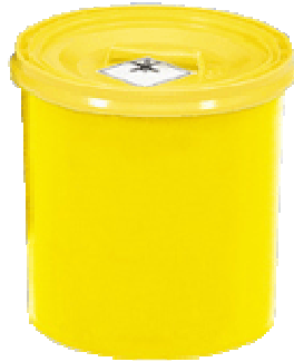
Medibin 30 L