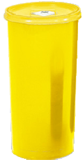
Medibin 60 L